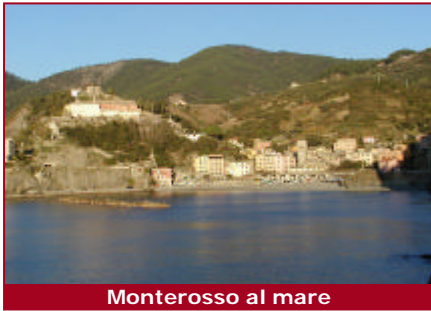
Monterosso al mare

Monterosso al Mare ist das östlichste der Cinque Terre Dörfer und das erste, das man erreicht, wenn man von Levanto kommt.