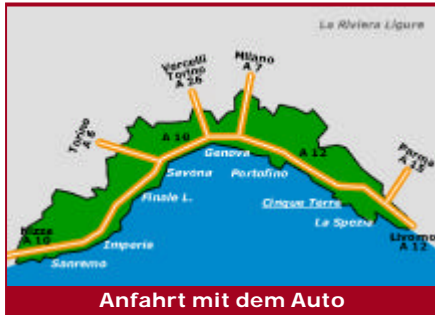
Anfahrt mit dem Auto

Jedes Dorf der Cinque Terre ist mit dem Auto erreichbar - allerdings muss man dabei grosse Umwege in Kauf nehmen.